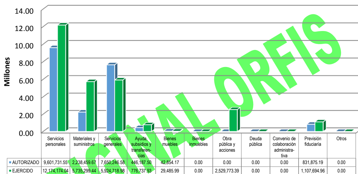
GRÁFICA 2 EGRESOS